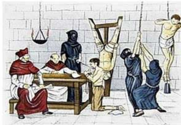
Método del cristianismo en España

El judaísmo mesiánico de hoy es la última expresión de un proceso que tiene un poco más de 100 años.