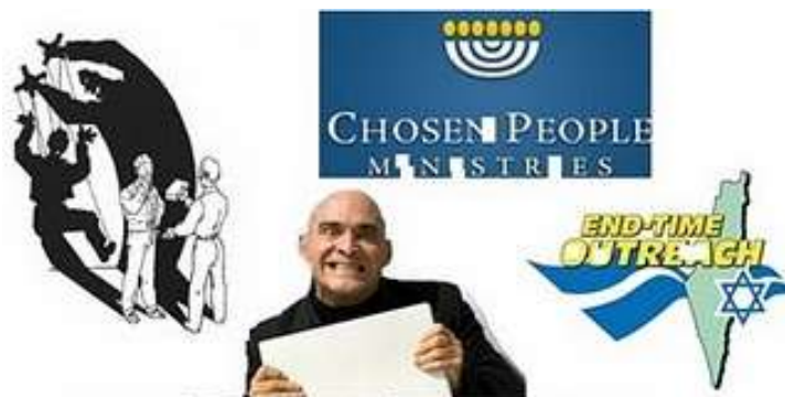
Método del cristianismo en Inglaterra